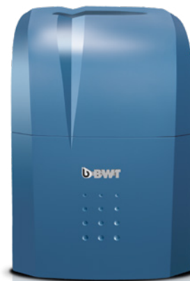
AQA life S