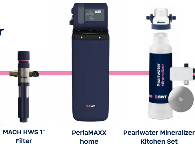
MACH HWS 1" Filter