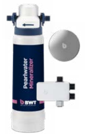
Pearlwater Mineralizer Kitchen Set

Jetzt scannen und informieren! bwt.com/opp