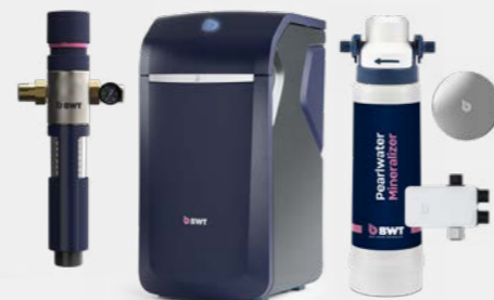
Produkt-Set PerlaMAXX deluxe