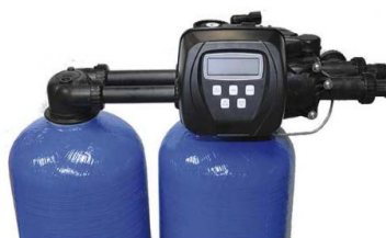
1. ábra VAD PRO kétoszlopos vízlágyító