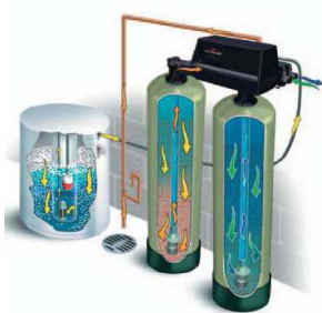
2. ábra Kétoszlopos készülék működési vázlat