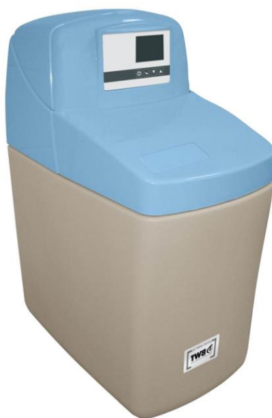
1. ábra –VAS termékcsalád