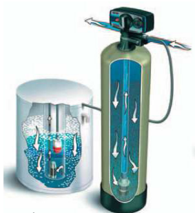
2. ábra Egyoszlopos készülék működési vázlata