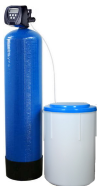
1. ábra VAS ECO egyoszlopos vízlágyító