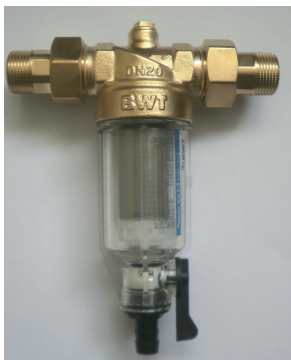
Protector Mini CR – hidegvizes szűrő