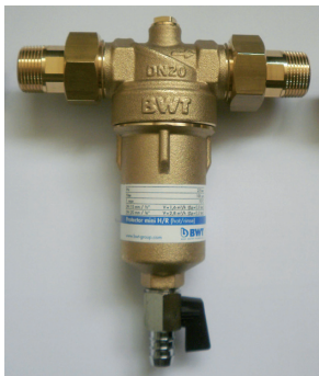
Protector Mini HR – melegvizes szűrő